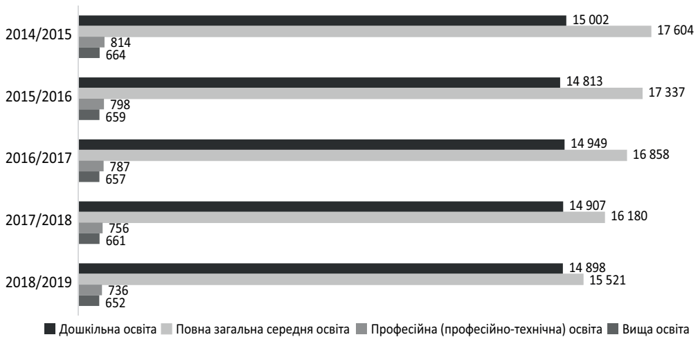
Рис. 2. Кількість закладів освіти за рівнями освіти в динаміці (2014/2015–2018/2019 н. рр.), одиниць

Упродовж 2014/2015–2018/2019 н. рр. кількість закладів освіти усіх рівнів зменшилась. Трансформація мережі закладів дошкільної, повної загальної середньої, професійної (професійно-технічної) та вищої освіти у бік зменшення здійснюється за рахунок оптимізації їх кількості, що відбувається, наприклад, шляхом реорганізації (ліквідації) закладів дошкільної, повної загальної середньої освіти та утворення на їх базі філій опорних закладів освіти. У 2018/2019 н. р. прослідковується зменшення загальної кількості закладів дошкільної освіти на 0,06 % (станом на кінець 2018 року), повної загальної середньої освіти на 4,1 %, закладів професійної (професійно-технічної) освіти на 2,6 %, закладів вищої освіти на 1,4 % (рис. 2).