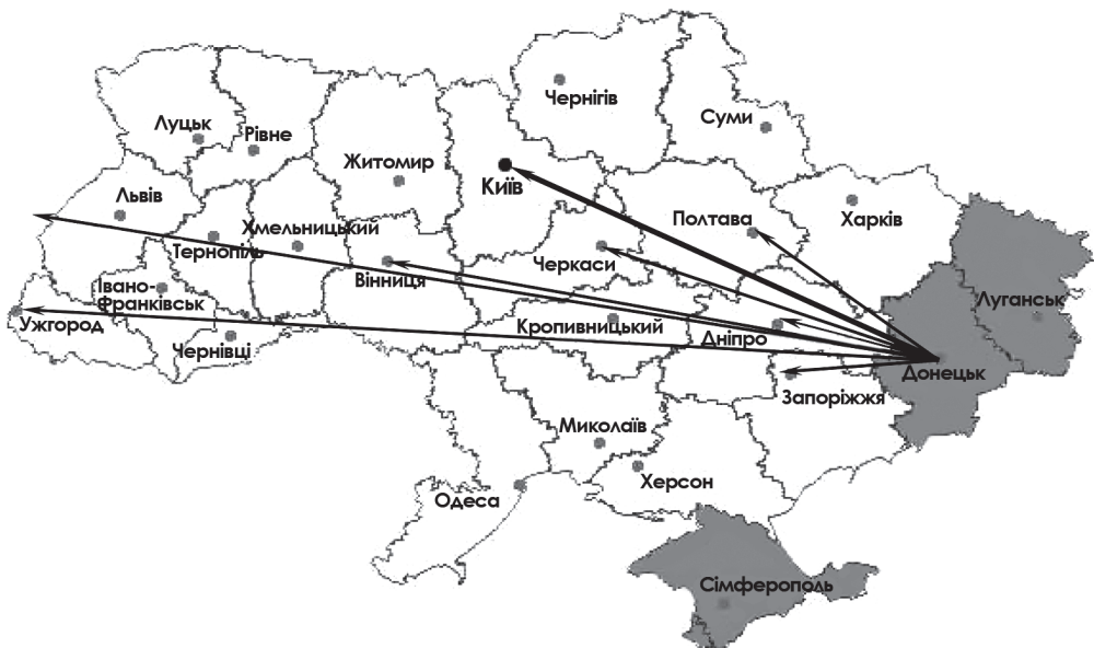
Рис. 1. Напрями переміщення з метою працевлаштування науково-педагогічних працівників економічного факультету ДВНЗ «Донецький національний технічний університет» через військовий конфлікт на Сході України

Очевидно, що такі втрати (тим більше це лише невелика частина від загальних втрат університету) не могли не відбитися на результатах його діяльності. І справді, хоча впродовж 2014–2017 рр. позиції ДонНТУ у всеукраїнських і міжнародних