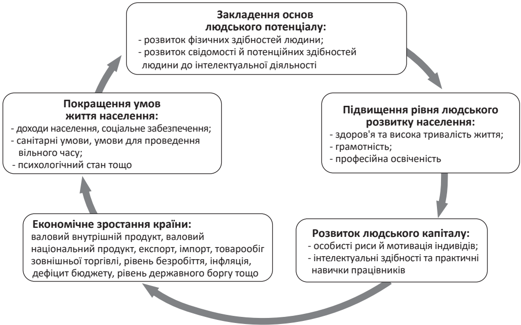
Рис. 2. Ітераційна модель впливу рівня людського розвитку в країні на її економічне зростання